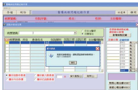
檢驗報告發送通知

本院於98年通過ISO27001驗證，並持續維護良好安全的管理，於99年通過追蹤驗證。資訊室全體員工皆取得ISMS/LA證書